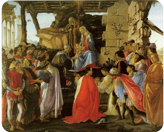
Adorazione dei Magi